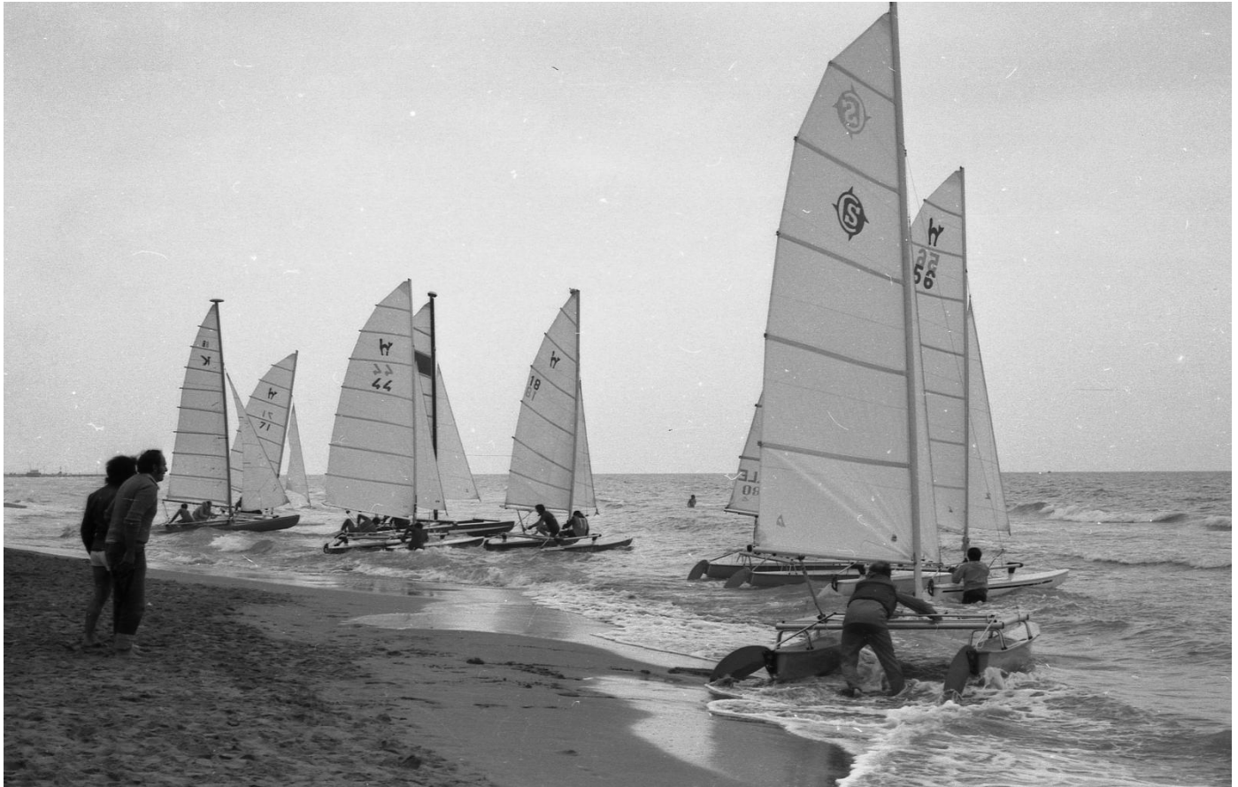
Partenza della Prima edizione della Regata 3x3 –Cesenatico Spiaggia di Levante - Giugno 1974

Le attività di regate dovranno essere svolte secondo le disposizioni in materia di contrasto e contenimento di diffusione del COVID 19 emanate dalla Federazione Italiana Vela che i Comitati Organizzatori attiveranno e a cui i partecipanti si dovranno attenere sotto la vigilanza da parte dello stesso Comitato Organizzatore. Eventuali casi di COVID 19 che dovessero essere rilevati nel corso della manifestazione saranno denunciati dal Comitato Organizzatore ai competenti organi sanitari preposti, che adotteranno le misure previste dalla normativa in vigore