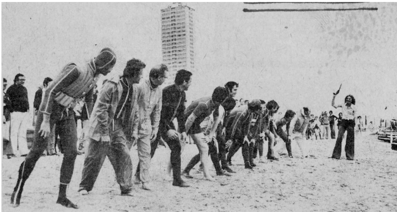
Partenza della Prima edizione della Regata 3x3 – Cesenatico Spiaggia di Levante - Giugno 1974